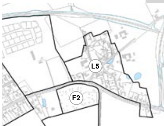
Kort over Nejlinge