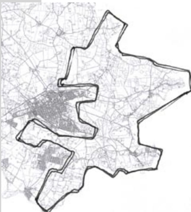
Omrids af "Skovlandet"