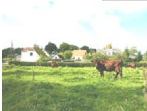
Nejlinges præcise afgrænsning mod landskabet