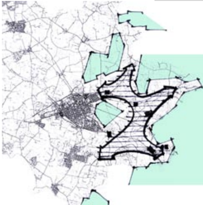
Diagram over skovlommerne

Landsbyens særpræg er blandingen af små gadehuse, et par mindre gårde med dyrehold, små grønninger, æblelunde og krogede veje.