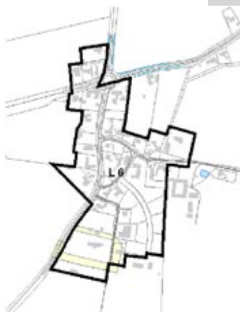
Kort over Mårum