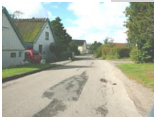
- og landsbymiljøer