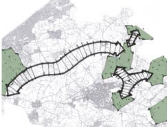
Diagram over spredningskorridoren

Miljøministeren har igangsat et Nationalparkprojekt, der berører Skovlandet i form af to såkaldte landskabskorridorer, hvis opgave er at skabe bedst mulige betingelser for dyrs og planteres vandring/spredning. Landskabskorridorerne løber fra Grib Skov via Pøle Å mod Arresø og fra Høbjerg Hegn til Valby Hegn og videre mod Tisvilde.