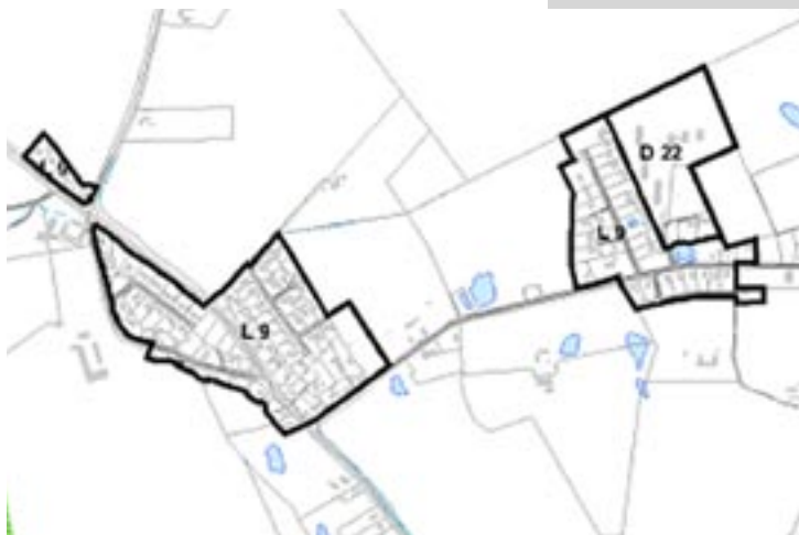
Kort over Kagerup