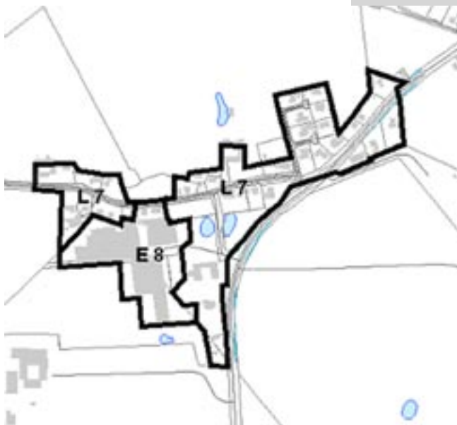
Kort over Ejlstrup