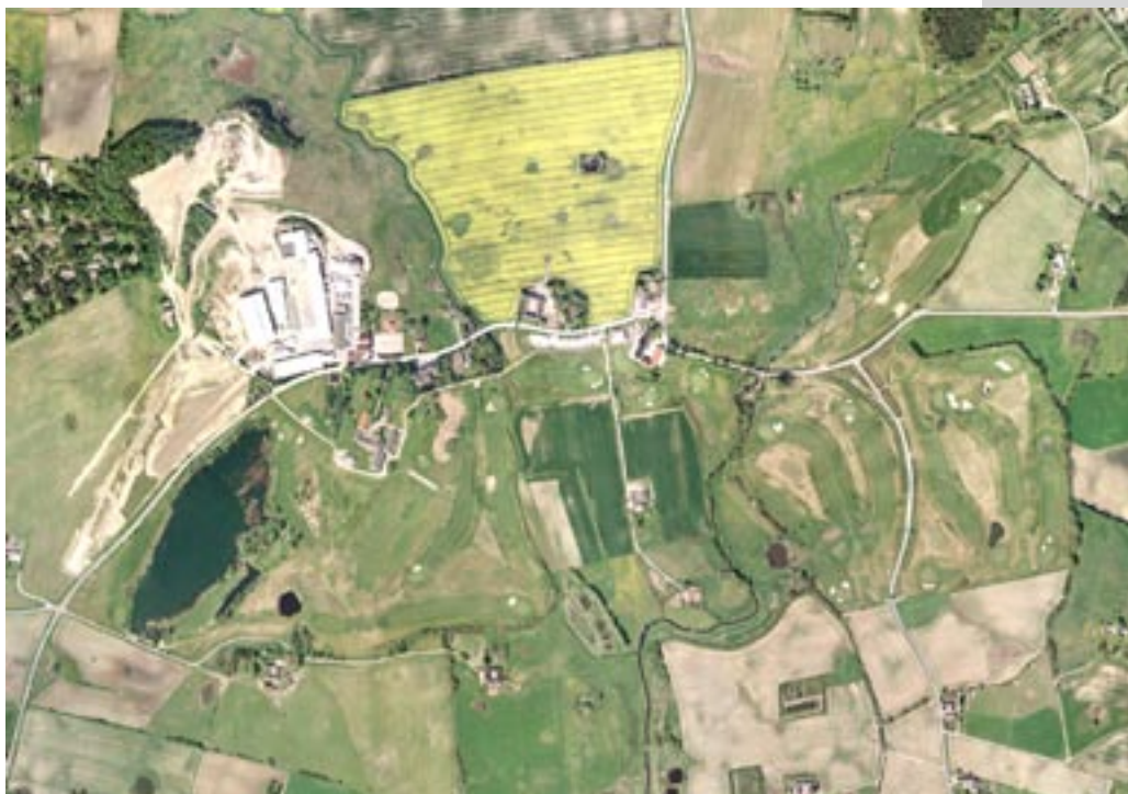
Luftfoto af golfbaneområdet