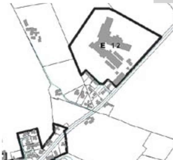
Kort over grund til erhvervshotel