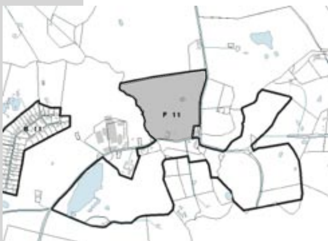
Kort over Pibe Mølle, den grå zone i område F11 viser udvidelsen